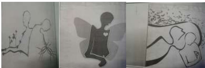
تصویر شماره‌ی ۴