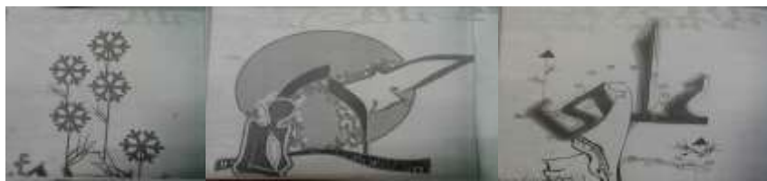
تصویر شماره‌ی ۱